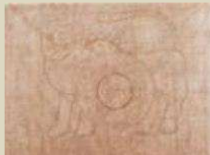
طلسم کهن ایرانی که گنج جویان آنرا مقدس می دانند . نماد شیر و خورشید