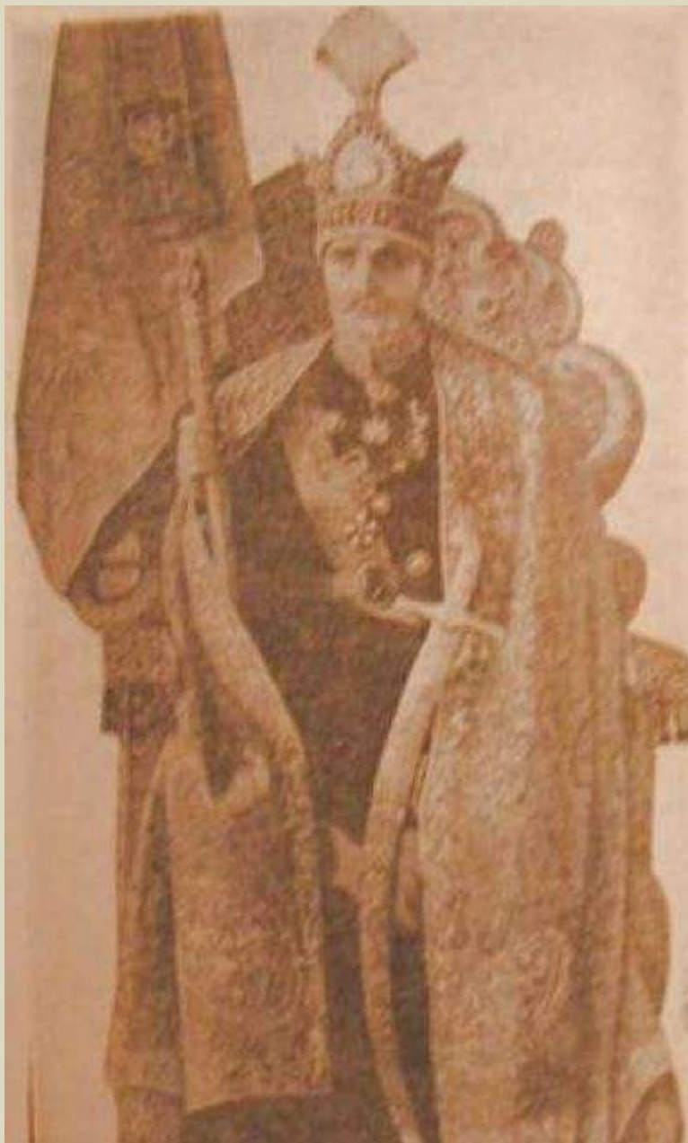
رضا شاه بزرگ به همراه درفش تاجگذاری اش

جنس درفش رضا شاه پهلوي از ابریشم به رنگ آبی آسمانی بوده است و در بالای آن آرم شیر و خورشید به همراه تاج سلطنتی و برگ های خرما منقوش بوده است . هر کجا که این درفش برافراشته می شده است ( در فرتور بالا ) به این چم ( معنی ) است که خود شاهنشاه حضور یافته است و برافراشته شدن آن به عهده ماموران گارد است.