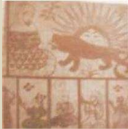
فرتوری از شیر و خورشید در رساله علم نجوم تالیف ابومعشر بلخی در کتابخانه ملی فرانسه