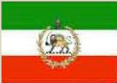
پرچم ایران در زمان رضا شاه و محمد رضا شاه پهلوی