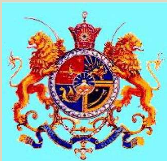
مهر سلطنتي محمد رضا شاه پهلوي