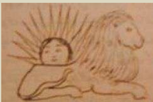
مدال شجاعت عباس میرزا