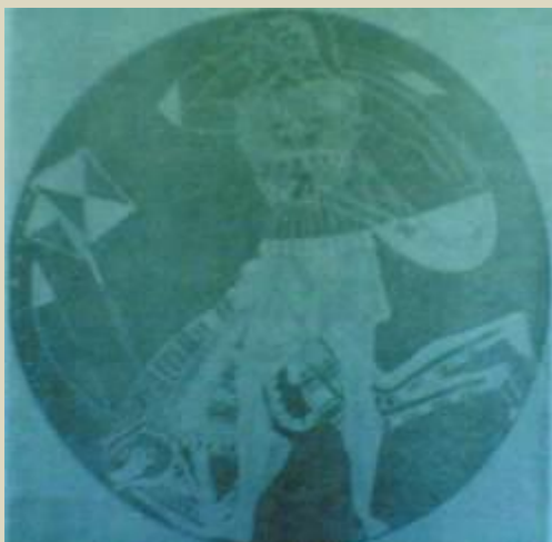
جام کشف شده از نبرد مرد یونانی و مرد پارسی و درفش ایرانیان