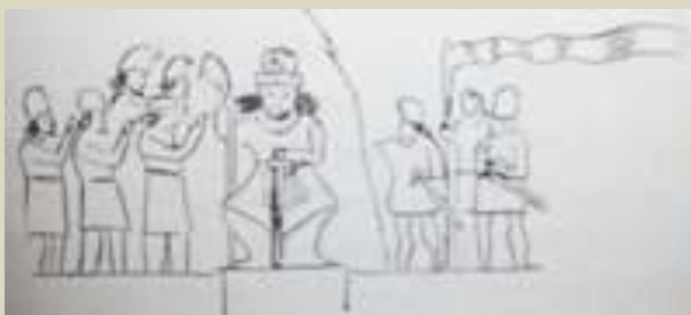
نقاشی ای از کتیبه های ساسانی و درفش کاویانی در بیشابور

در سنگ نگاره های شاهنشاهان ساسانی، چندین بیرق ملی به جای مانده است که در هنگام تاجگذاری و لشکر کشی ها برافراشته می شده است. در بیشابور سنگ نگاره ای وجود دارد که متعلق به شاهنشاه شاهپور دوم است. پرفسور هرتزفلد آنرا رمز گشایی نمود و درفش ملی ایران را در آن روزگار بیرقی بلند با پارچه ای دراز تشخیص داد.