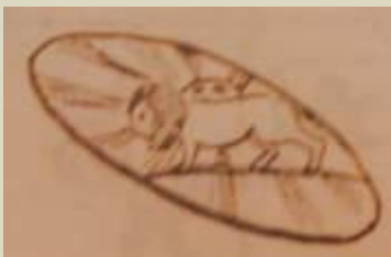
سپر بدست آمده از ارتش نادر شاه افشار

درفش شاهي يا بيرق سلطنتي در دوران نادرشاه از ابریشم سرخ و زرد ساخته مي شد و بر روي آن تصوير شير و خورشيد هم وجود داشت اما درفش ملي ايرانيان در اين زمان سه رنگ سبز و سفيد و سرخ با شيري در حالت نيمرخ و در حال راه رفتن داشته که خورشيدي نيمه بر آمده بر پشت آن بود و در درون دایره خورشيد نوشته بود " :المک الله " سپاهيان نادر در تصويري که از جنگ وي با محمد گورکاني، پادشاه هند، کشيده شده، بيرقي سه گوش با رنگ سفيد در دست دارند که در گوشه بالائي آن نواري سبز رنگ و در قسمت پائيني آن نواري سرخ دوخته شده است. شيري با دم برافراشته به صورت نيمرخ در حال راه رفتن است و درون دایره خورشيد آن باز هم " المک الله " آمده است. بر اين اساس ميتوان گفت پرچم سه رنگ عهد نادر مادر پرچم سه رنگ فعلي ايران است. زيرا در اين زمان بود که براي نخستين بار اين سه رنگ بر روي پرچم هاي نظامي و ملي آمد، هر چند هنوز پرچمها سه گوشه بودند.