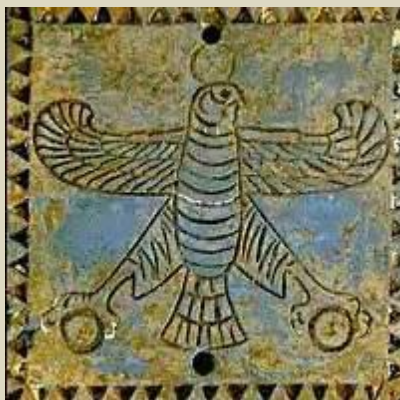
درفش شکوهمند ارتش شاهنشاهی کورش بزرگ

به گفته هرودوت و گزنفون ارتش ایران در زمان کورش بزرگ و داریوش بزرگ دارای نشانهای برافراشته ای بودند که در راس سپاه قرار می گرفته است. هرودوت می نویسد زمانی که خشیارشا بزرگ به اندیشه انتقام از یونانیان افتاد و راهی آنجا شد در راه در نزدیکی هلسپونت خورشید گرفت و خشیارشا از این علامت برافروخته شد و موبدان و مردان دینی را صدا نمود و از آنان تعبیر این کار را خواست. پیشگویان و موبدان گرفته شدن خورشید را علامتی بد هنگام برای یونانیان نامیدند. پس او به عزمی راسخ تر روانه یونان شد.