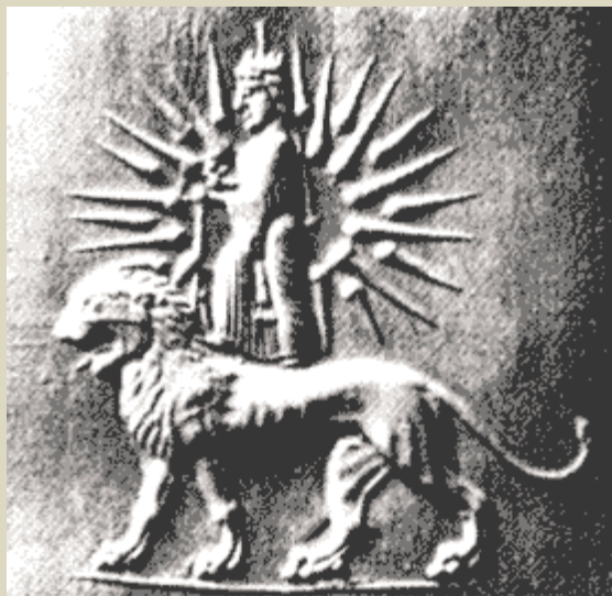
نگاره ارزشمند تندیس میترا و شیر و خورشید باستانی - موزه آرمیتاژ لنین گراد - با سال ۴۰۰ پیش از میلاد