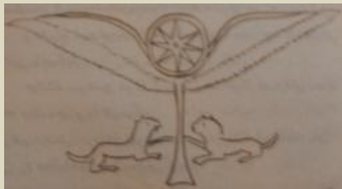
استوانه پادشاه میثانی به سال ۱۴۵۰ پیش از میلاد درباره نماد شیر و خورشید