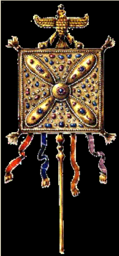
درفش شکوهمند ارتش شاهنشاهی داریوش بزرگ

*خورشید مظهر شکوه، فر ایزدی و عمر جاوید در ایران است. در هفت پاره از اوستا اهورامزدا چون خورشید تصور شده است و در جای دیگر خورشید و نور چشم خداوند نامیده شده است. ارداویرافنامه در کتاب خود نوشته است سپس به دنیای دیگر سفر نمودم و از آسمانها دیدن کردم. آنگاه به جایگاه کردار نیک و خورشید رسیدم. روان پاک خداوند را آنجا دیدم.