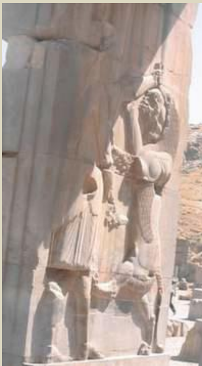
سنگ تراشیهایی پرسپولیس که نشان از برتری ایران بر کشورهای دیگر دارد

شیر و خورشید نیز بی گمان یکی دیگر از نشانه‌های ملی ایران است که سابقه‌ای بسیار کهن دارد. کهن‌ترین پیشینه این اثر ملی مربوط به استوانه‌ای است مربوط به پادشاه سوسه‌تر پادشاه میثانی است که در حدود ۱۴۵۰ سال پیش از میلاد سلطنت می‌کرده است. در این استوانه شکل خورشید با بالی گشوده نمایان است و میله‌ای در وسط آن قرار دارد و دو شیر در طرفین آن واقع است. آثار دیگر هخامنشان و چندین سنگ‌نگاره از شیر نشان از قدرت کشور ایران دارد. همانطور که بسیار از کشورها نمادی از حیوانات را برای خود می‌دانند ایران پس از اسلام شیر و خورشید باستانی را که در گذشته و شاهنشاهان باستانی نیز مورد احترام و نماد قدرت بوده را برگزیده‌اند و امروزه هم بسیاری از ایرانیان آنرا تنها نماد ملی ایران می‌دانند.