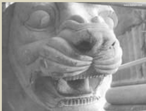
تنديس شیر سنگي کشف شده در پاسارگاد ( در زمان شاهنشاهی کورش بزرگ )