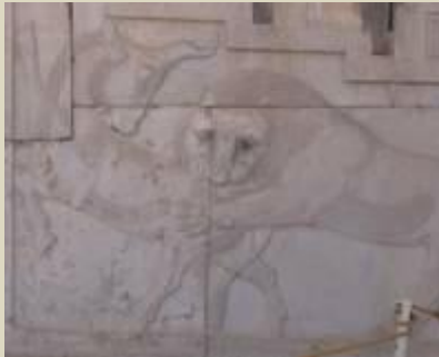
تندیس نبرد شیر ایرانی با اقوام دیگر ( در زمان شاهنشاهی داریوش بزرگ )